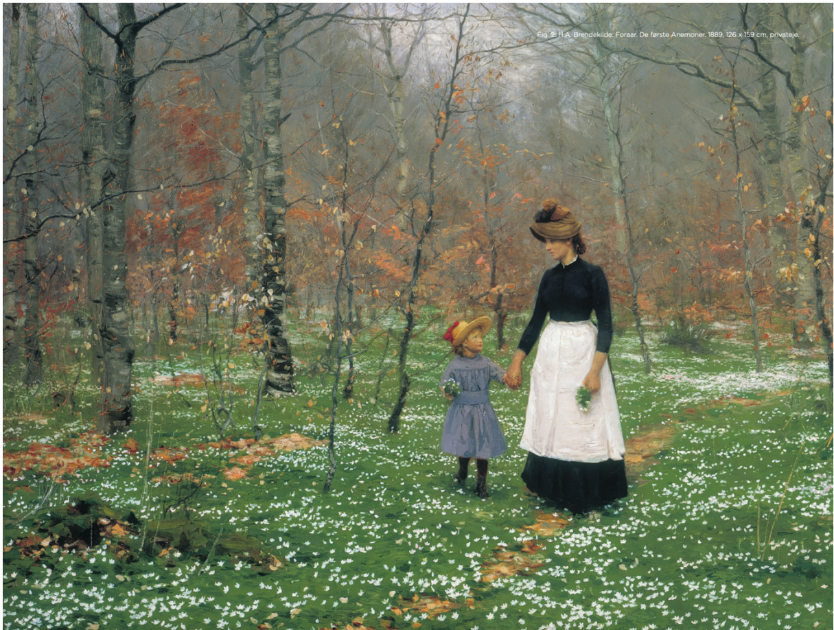
H.R. Brendekilde, „Foraar. De første anemoner“, 1889

Dorte Bruun Christensen Postfach 4 08 01 10064 Berlin www.bruunchristensen.com info@bruunchristensen.com 0049 (0)176 – 5538 2525