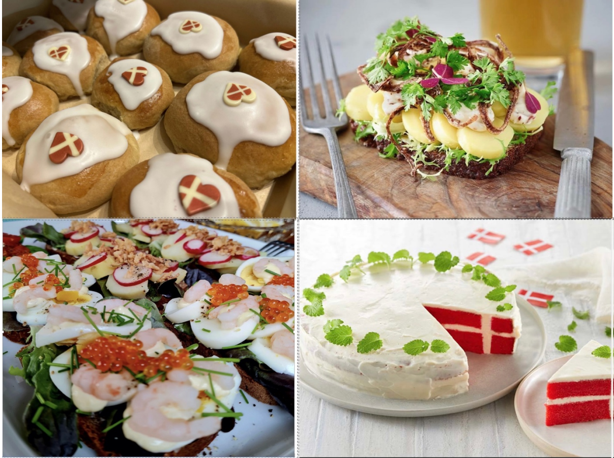
Fotos: Diverse Fotos vom Workshopessen